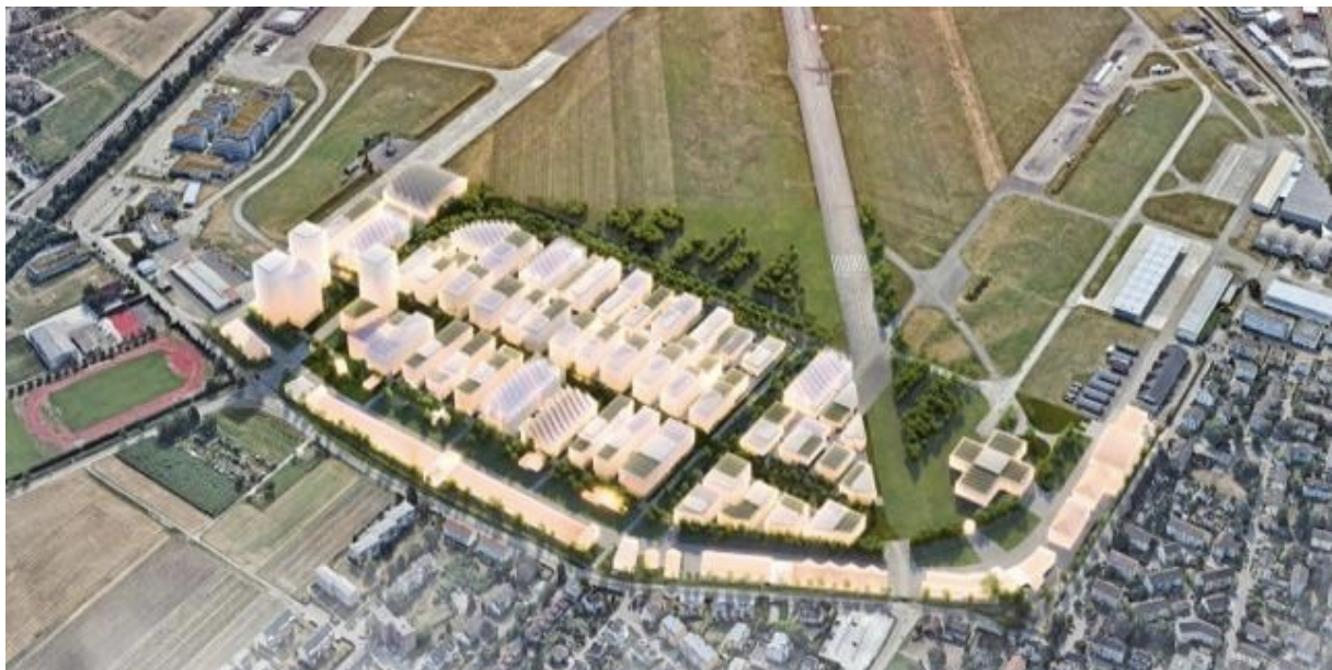
Screenshot Präsentation Infoveranstaltung vom 26.12.2021