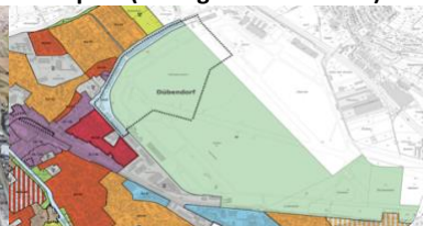
Zonenplan (Vorlage Gemeinderat)